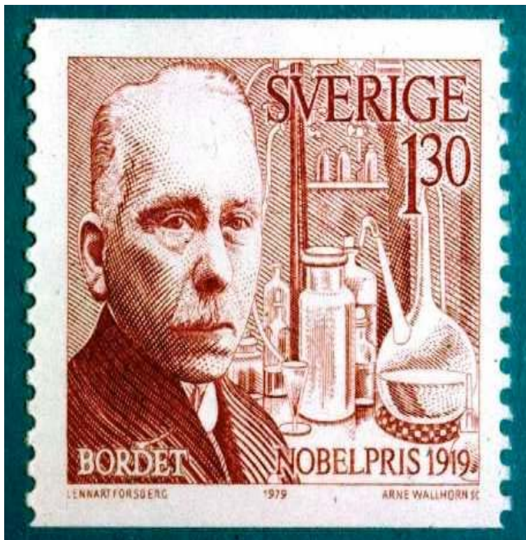
Figur 3. Jules Bordet (1870 – 1961). Den förste föreståndaren för Pasteurinstitutet i Bryssel som grundades 1901. Professor i bakteriologi 1907. Nobelpristagare i fysiologi och medicin 1919.

Dessa studier inspirerade Wasserman och andra forskare, vilket ledde till utvecklandet av Wassermantestet och andra komplement-fixationstest. När Bordet återvände till Belgien och Bryssel blev han direktör för det där nybyggda Pasteurinstitutet och senare professor i bakteriologi. Han bidrog med många ytterligare immunologiska och bakteriologiska upptäckter. För detta tilldelades han 1919 års Nobelpris i fysiologi och medicin.