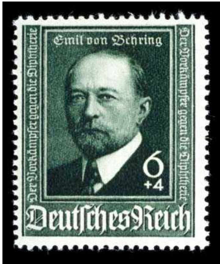
Figur 1. Emil von Behring (1854 – 1917). Professor och direktör vid institutet för Hygien och experimentell terapi i Marburg. Den förste Nobelpristagaren i fysiologi och medicin (1901). Hans läromästare Robert Koch fick inte sitt Nobelpris förrän 1905.

Julnatten 1891 prövades för första gången behandlingen på människa. I Berlin gavs då difteriantitoxin till ett barn med livshotande difteri. Därmed var serumterapi född. För denna upptäckt tilldelades Behring 1901 det första Nobelpriset i fysiologi och medicin.